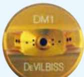
DM1 (ゴールド) ・ベース用