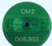
DM2 (グリーン) ・クリアー用