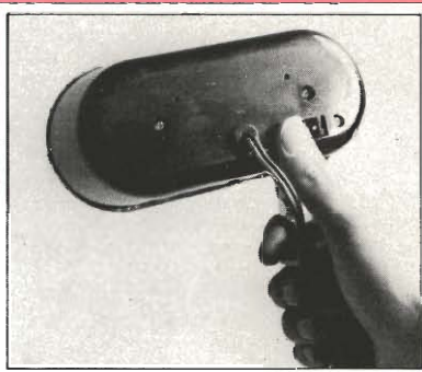
② 片手で操作できる