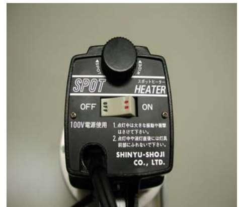
塗板温度上昇データ（JCD120V-650Wタイプ） 塗板①グレー 塗板②クリーム 距離250mm

また、下上昇データの「650-W-①」は「WIDE」位置で試験塗板①の温度変化を測定したものです。