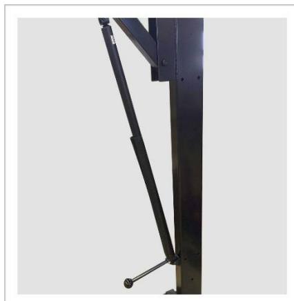
装着後 (ダンパー伸ばした時)