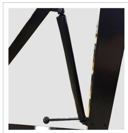
装着後 (ダンパー縮めた時)