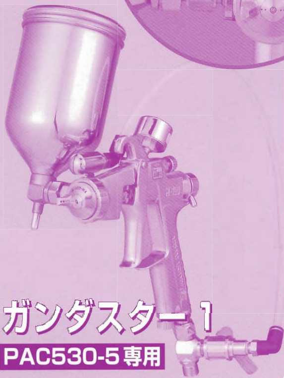
ガンダスター1 PAC530-5専用